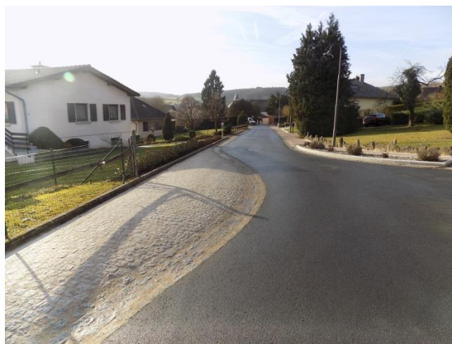
Instandsetzung Om Maes & Kerwech – Greiveldingen Réaménagement Om Maes & Kerwech - Greiveldange