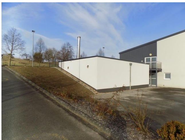
Holzackschnitzelanlage – Sporthalle Stadtbredimus Chauffage copeaux de bois – hall sportif Stadtbredimus