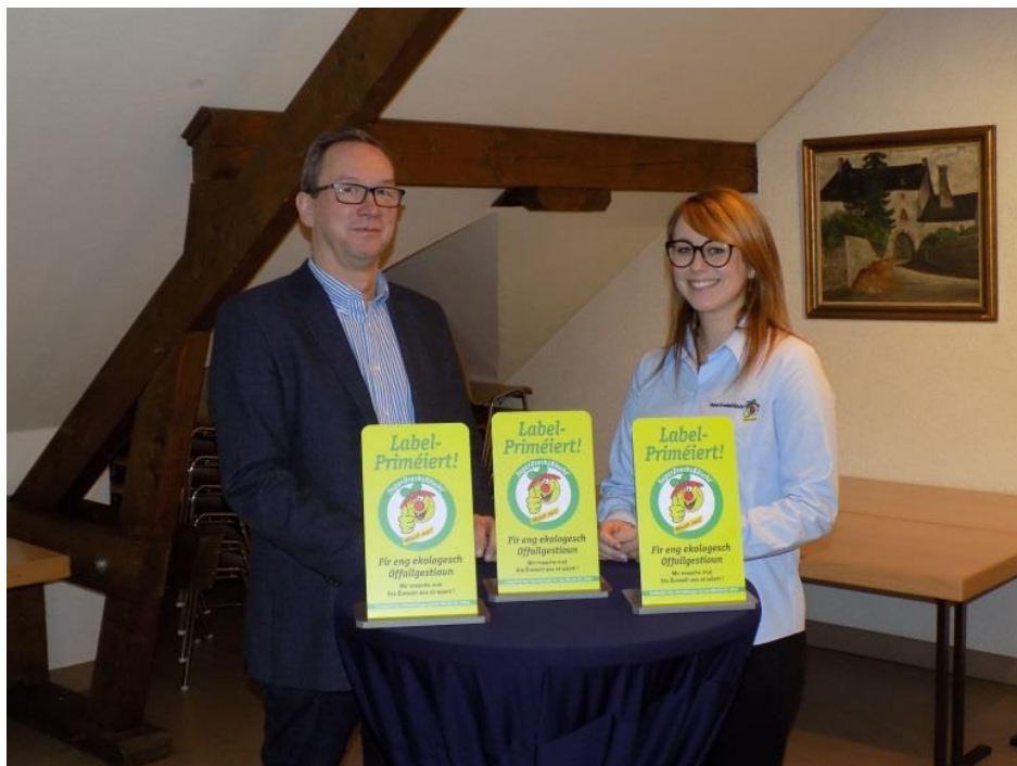
Zertifikatioun „Superdreckschächt fir Betriber“ – 28.10.2016