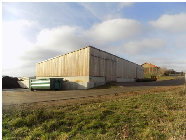
Lagerhalle für die Gemeinde / Hangar communal « Om Wäissebiere » - Stadtbredimus