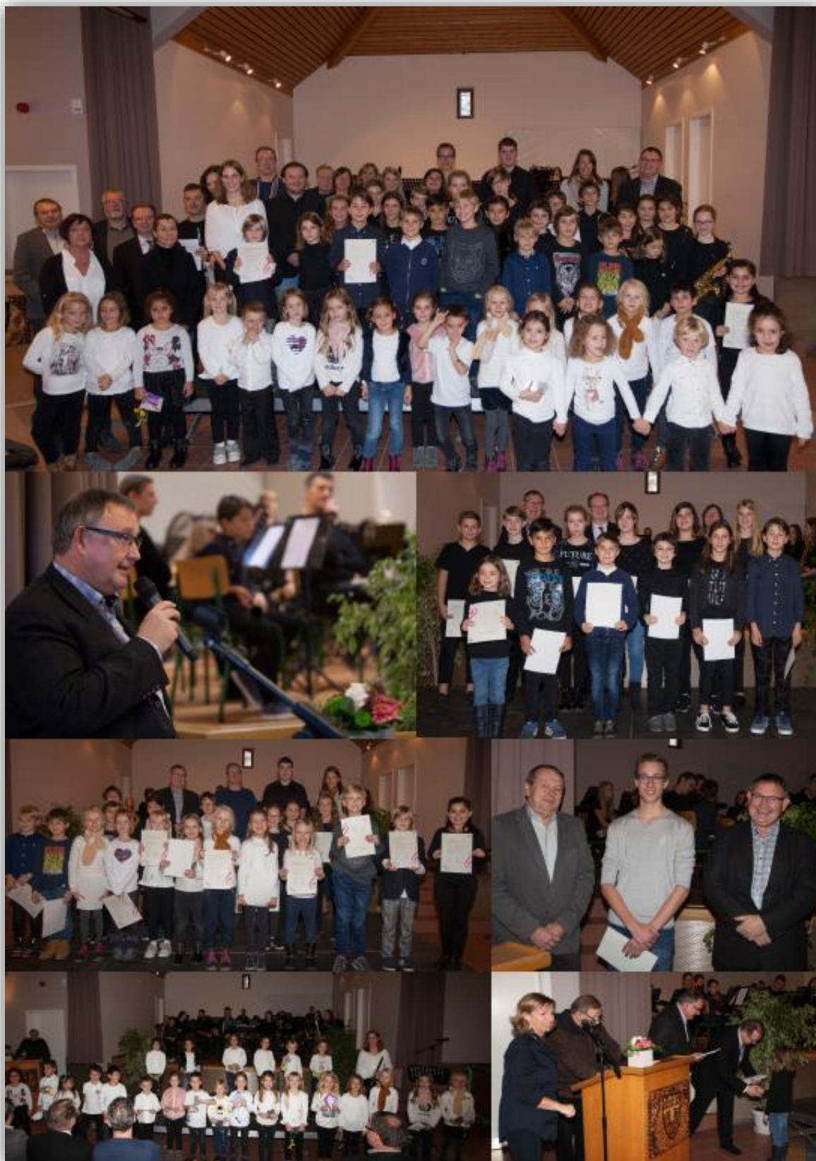
Auditioun 2018 vun de Museksschoule vun der UGDA aus de Gemenge Bous, Stadbrriedemes a Waldbriedemes 25.11.2018 zu Greiweldeng am Veräinbau Concert vun de Museksschüler 2018/2019 Diplomiwwerreechung vum Schouljoer 2017/2018