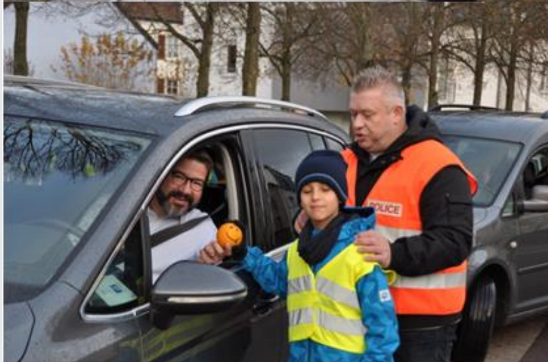
Am Zesummenaarbecht mat der Police huet d'Verkéierskommissioun den 12. November 2018 zu Greiweldeng eng Vitesse Sensibilisatioun Campagne zesumme mat de Kanner aus dem Cycle 3.1 organiséiert.