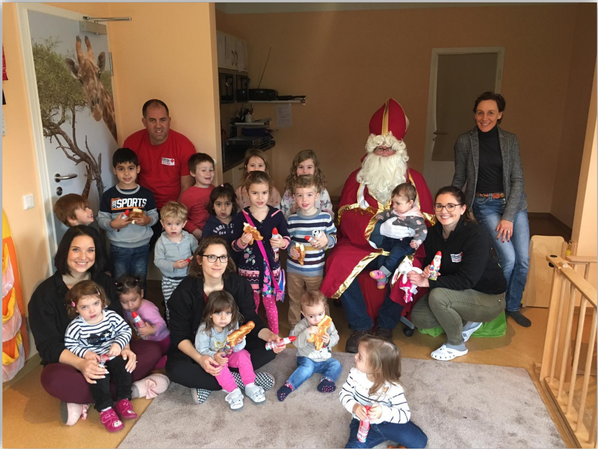
De Kleeschen zu Besuch an der Crèche „HUESENASCHT“ zu Stadbriedemes – 06.12.2018

D'ganz Ekip vum der Stadbriedemässer Gemeng wënscht Iech e schéint a glécklecht neit Joër