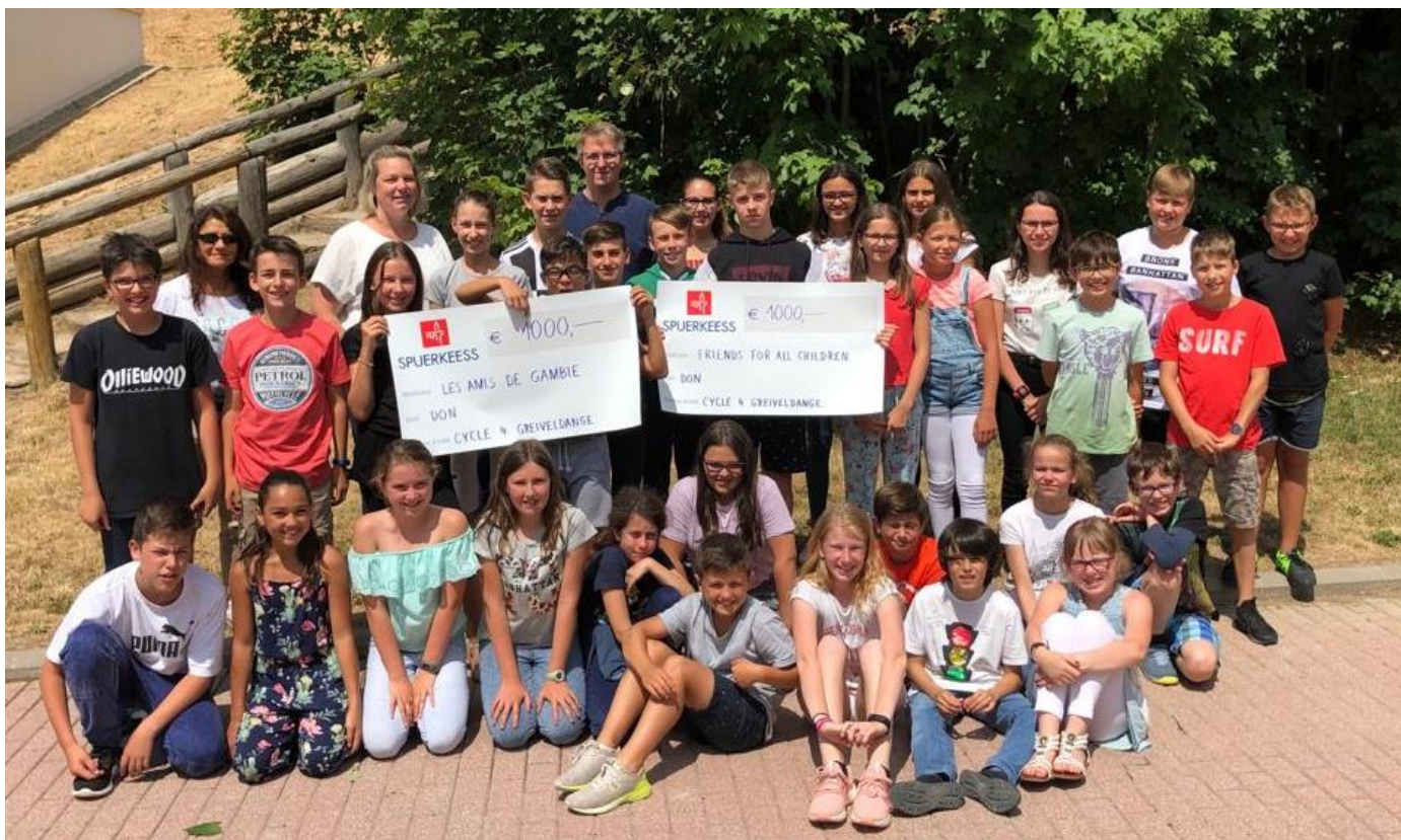
De Cycle 4 vu Greiweldeng (Schouljoer 2018/2019) huet un d'Associatiounen « Les amis du Gambie » a « Friends for all children » gespent